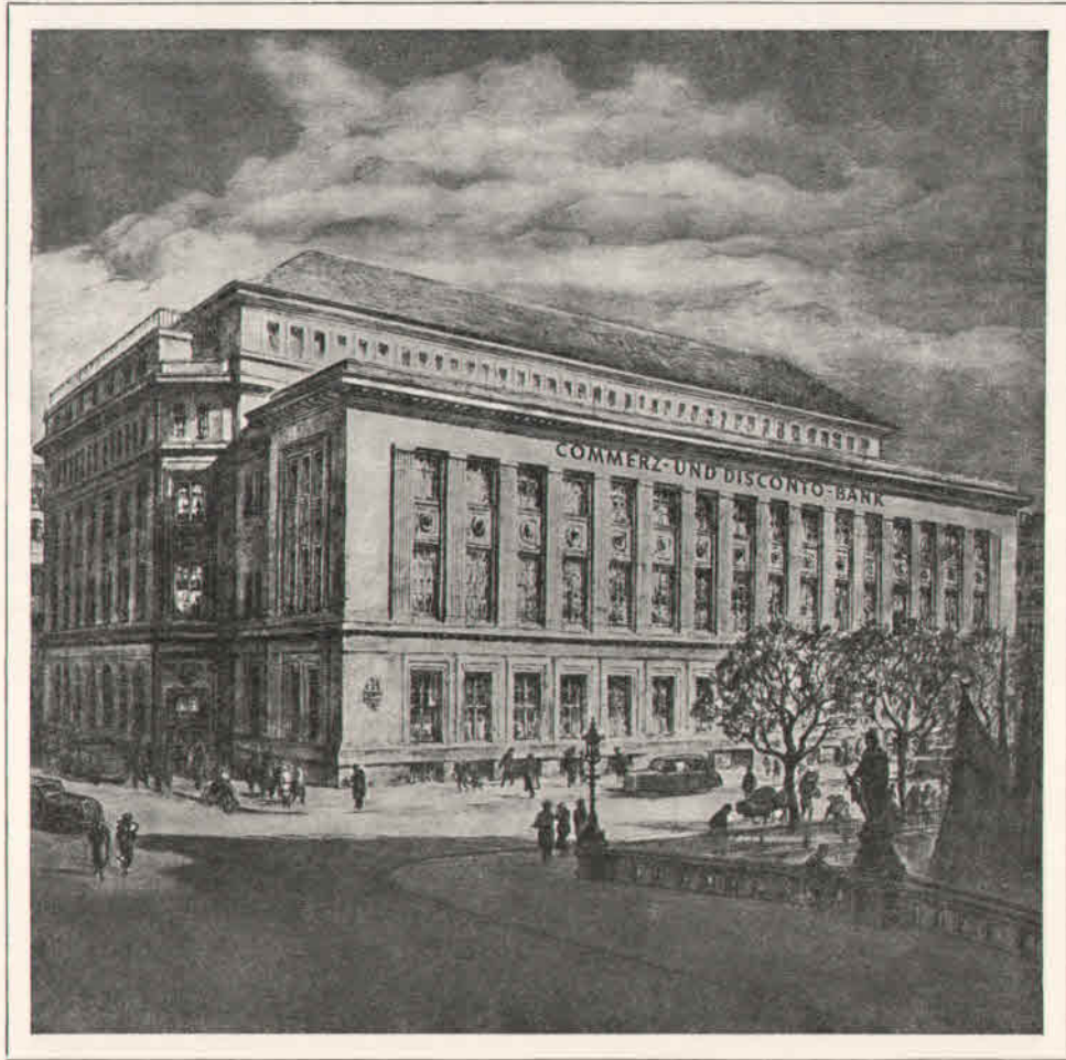
Hauptverwaltung in Hamburg von der Trostbrücke aus gesehen